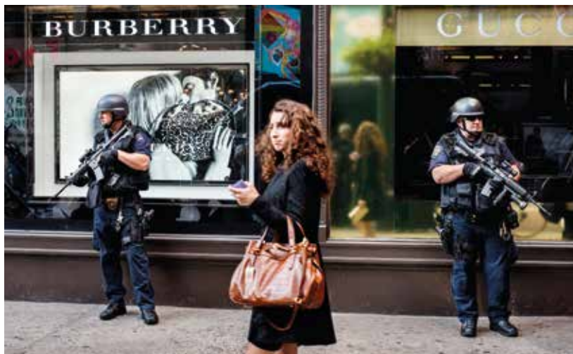
En kvinde går forbi to svært bevæbnede politimænd på vagt uden for et stormagasin i Manhattan, USA(2008).