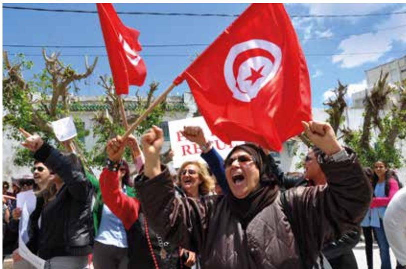
Kvinder protesterer foran den tunesiske forfatningsgivende forsamling med krav om ligestillingstiltag i valgloven, Tunesien (2014).