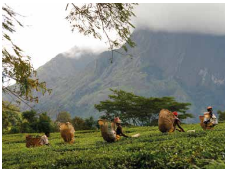
Teen høstes i Mulanje i det sydlige Malawi (2009)

Maria bor i Malawi og arbejder som teplukker. Hendes løn ligger under grænsen for ekstrem fattigdom på 1,25 dollars om dagen per husstand, og hun kæmper for at brødføde sine to børn, der er kronisk underernærede. Men tingene er begyndt at ændre sig. I januar 2014 hævede Malawis regering mindstelønnen med ca. 24 %. En koalition ledet af Ethical Tea Partnership og Oxfam søger nye veje for at gøre anstændige arbejdsforhold bæredygtige på længere sigt 63 .